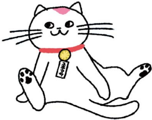
日本行政書士会連合会 公式キャラクター 行政(ユキマサ)くん